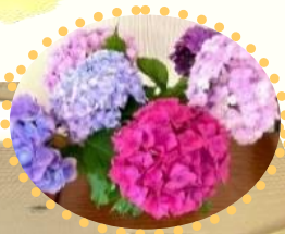
北ノ川 多目的集会所